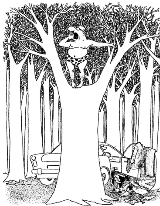
Klaus Becher: Kleine Freiheit. Fackelträger 1989. Aus: Ethik und Unterricht, 2/01, S. 24