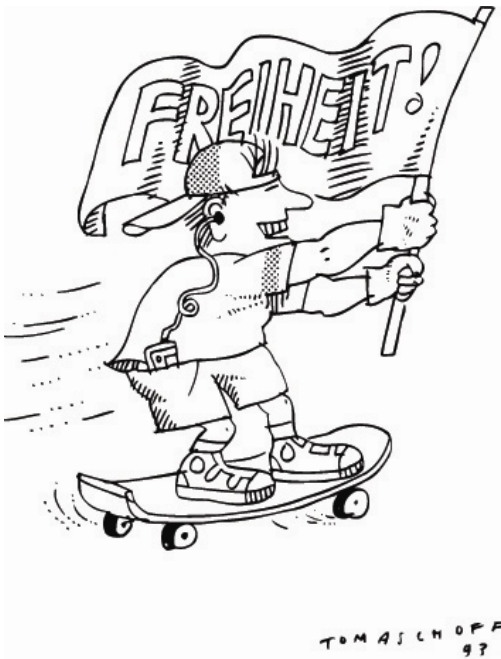
Aus: Ethik und Unterricht, 3/98, Titelseite