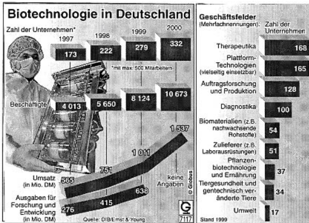
Globus Infografik, 18. Juni 2001