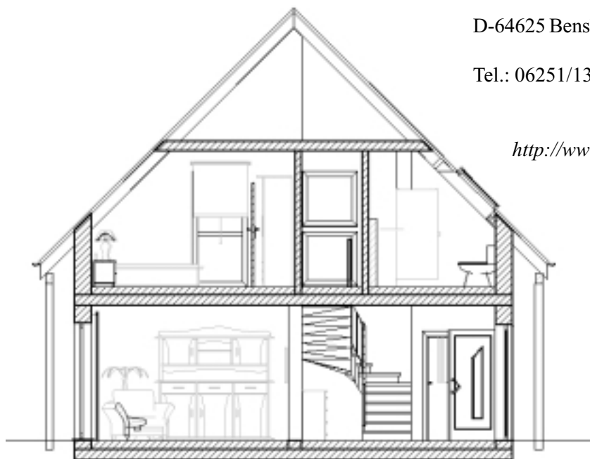
Schnitt in 2D